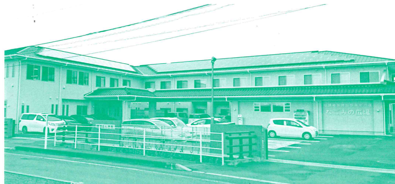
▲ 国道に面しておりアクセスも便利

当施設は地域的、環境的に恵まれた立地条件にあり、この恵まれた環境の中で施設の機能を十分に生かしながら多様化する利用者の方々のニーズに即したサービスの提供を図っております。